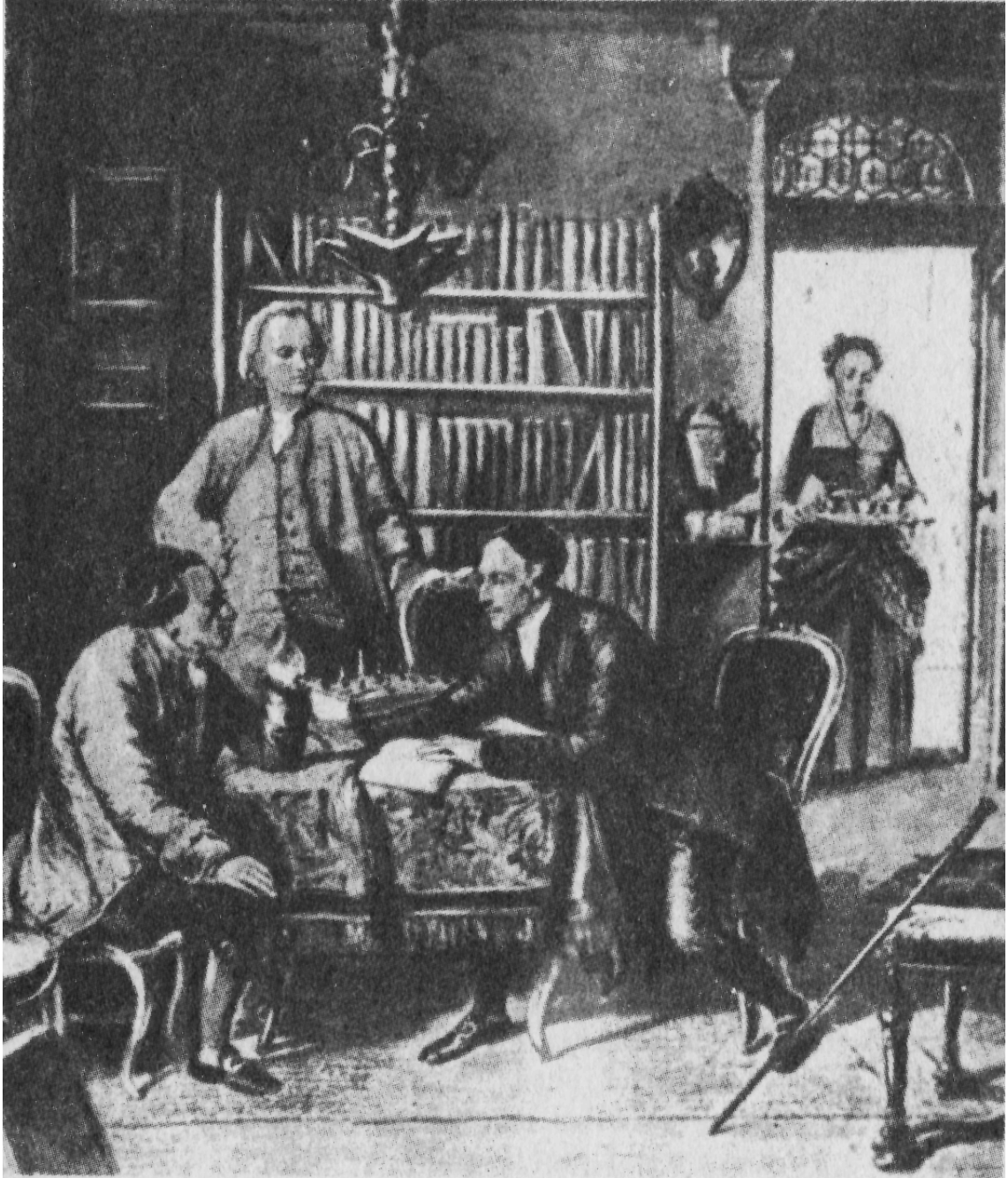
Lessing y Lavater en casa de Moisés Mendelssohn.