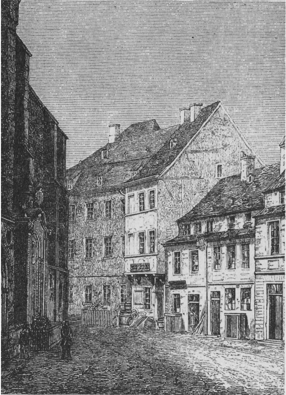
Casa donde vivió en Berlín